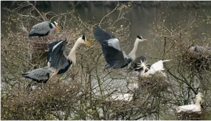
De broedkolonie blauwe reigers en lepelaars fotografeerde ik vanuit de openbare vogelkijkhut in de Blauwe Kamer bij Rhenen. Van verstoring is hier absoluut geen sprake. Sigma sport 150-600 mm op 600mm; 1/250s bij f6.3; ISO 2000.