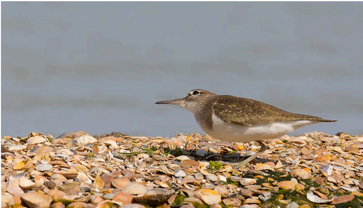
Deze oeverloper keek regelmatig angstig omhoog of er een roofvogel overvloog. Sigma sport 150-600mm op 500mm; 1/2000s bij f8; ISO 640.