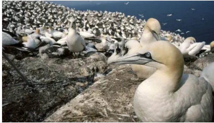
Nestelende jan-van-genten zijn honkvast en je kunt je zonder verstoring tot dicht bij de vogels begeven. Hier kon ik de vogels zelfs met een groothoeklens fotograferen. Nikkorlens 18-55mm op 24mm; 1/125s bij f11; ISO 500.

Het maken van nestfoto's is not done. De kans op verstoring is te groot en een belangrijk uitgangspunt is: de vogel gaat altijd voor het plaatje. Er zijn jammerlijke voorbeelden van broedende roerdompen en bruine kiekendieven waarbij het riet in de omgeving is weggehaald, om de vogel op het nest te kunnen fotograferen. Nest en jongen zijn nu gemakkelijk te vinden door bijvoorbeeld kraaien en vossen.