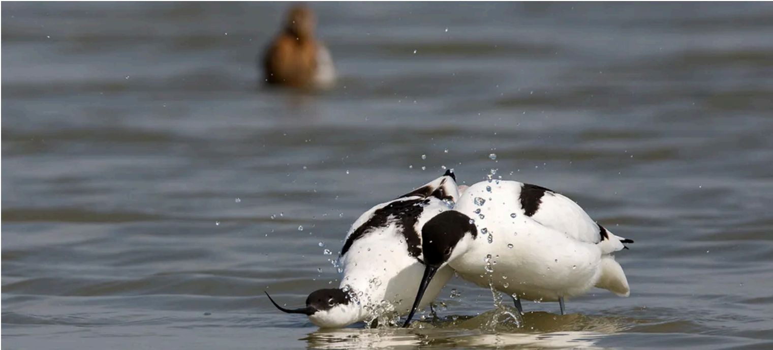
Kluut water spatten